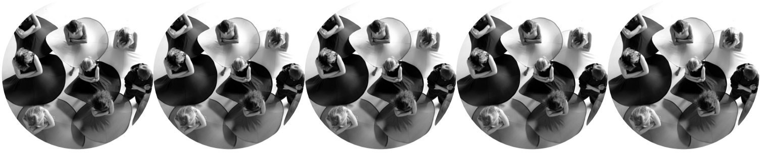
PARADE Tanzprojekt mit den Tanzkindern des DOCK 11 und EDEN