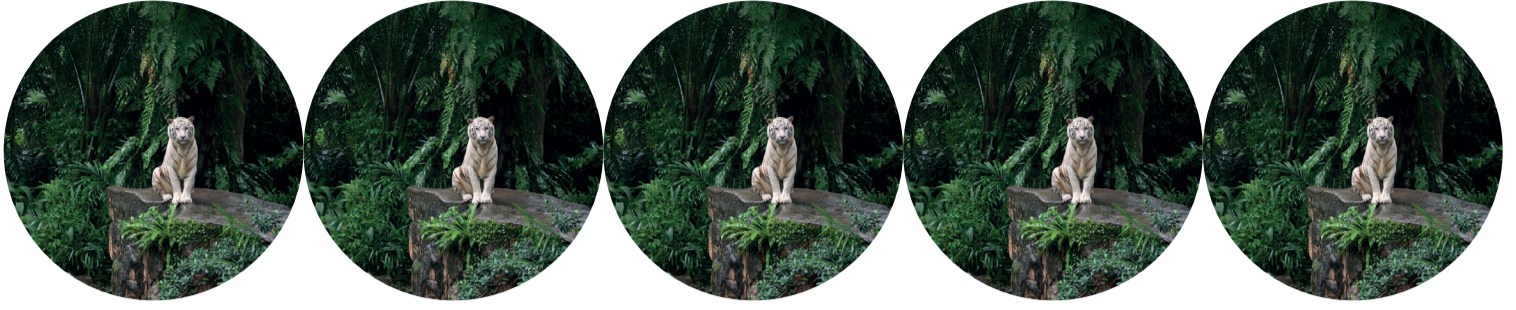
Foto: SHY BY NATURE Shop im ersten Hof im DOCK 11